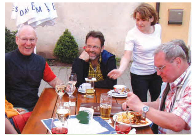
Brotzeit und gute Laune am Ende der Wanderung

A | Der Weg über die Burg führt geradewegs weiter zum Wanderparkplatz. Dort folgen wir wieder dem (Ipsheim: 2 km) und steuern auf die Burganlage zu.