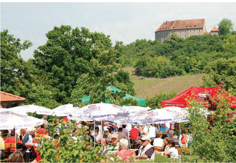
Garten am Weinberghaus vor der Burg Hoheneck

Im spitzen Winkel zweigt, nachdem wir die Burg schon fast umrundet haben, links ein schmaler Pfad nach unten ab, der sich vor einem Anwesen dann gabelt. Hier, ohne erkennbare Markierung, wieder links halten und bei der gleich folgenden Wegeteilung dann auf den rechten, verwachsenen Waldpfad weiter (nicht durch den Durchlass) auf eine Wiese hinaus. Nach einer Heckenreihe noch einmal links einschwenken und dann schnurgerade hinein nach Ipsheim , in den Weinort im Aischgrund. Drehen Sie sich kurz noch mal um und genießen das schöne Panorama. Nach der Birkenstraße jetzt kurz rechts in der Eichenstraße bleibend, halten wir uns dann wieder links (Hohenecker Straße) und erkennen vor uns schon die Bahnlinie und den Übergang in den Ortskern hinein. Manche Gast- oder Heckenwirtschaften liegen in unmittelbarer Nähe zum Bahnhof, ideal um in einer den Tag ausklingen zu lassen.