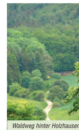
Waldweg hinter Holzhausen

Vor einem allein stehenden Haus (Nummer 7) gabelt sich der Weg. Der Linke, der sich später in kleinen Bögen leicht