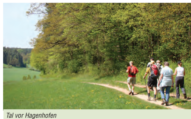
Tal vor Hagenhofen

Fotos Titelseite – oben: Bocksbeutelflasche als Deko, links unten: Wandergruppe in der Ziegelleite, rechts unten: vor Hagenhofen