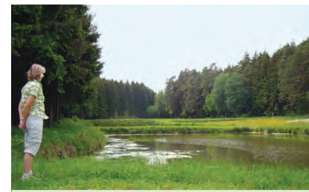
Blick über die Weiher Richtung Aurachquelle

Eine liebevoll per Handarbeit gestaltete Tafel informiert über „die Aurach – das Auerochs-Gewässer“, die weit von hier ihre eingezäunte Quelle hat. Zu ihr stoßen wir, wenn wir linker Hand, ab sofort mit dem – Richtung Eichel-